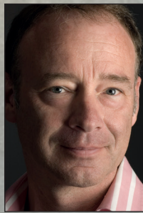
Hans-Jürgen Hufeisen Komponist, Blockflötist