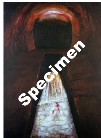
Der Leichnam Jesu wird ins Grab gelegt