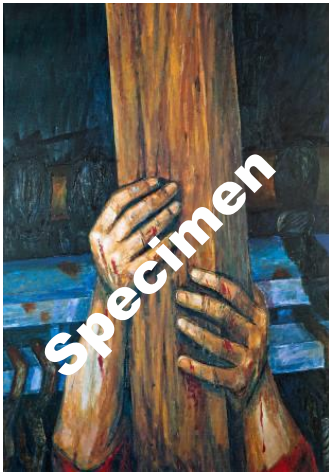
Jesus nimmt das Kreuz