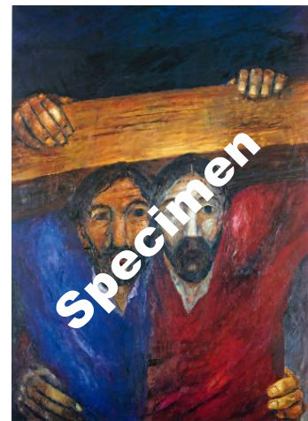
Simon hilft Jesus das Kreuz zu tragen