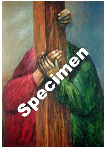
Jesus begegnet seiner Mutter