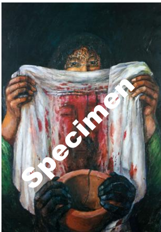
Veronika reicht Jesus das Schweißstuch