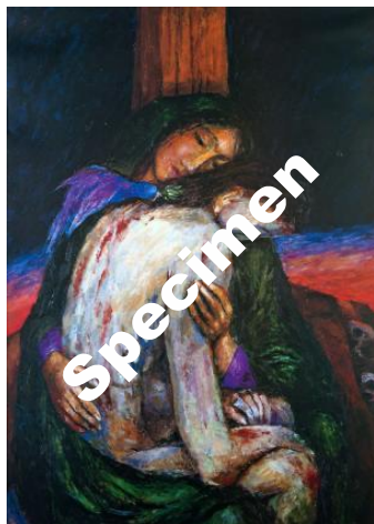
Jesus wird in den Schoß seiner Mutter gelegt