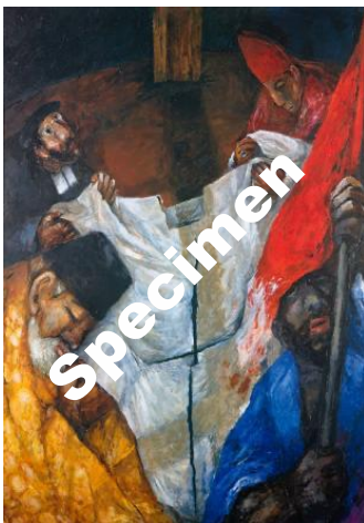
Jesus wird seiner Kleider beraubt